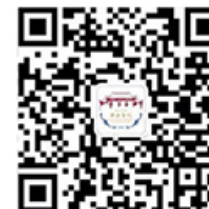
华西官方微信公众号